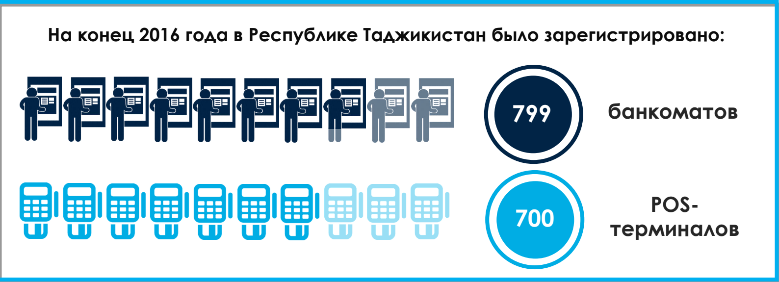
Рисунок 3: Количество банкоматов и POS-терминалов в Таджикистане

Публикация подготовлена в рамках Группы Всемирного банка, Глобальных Практик по финансам и финансовым рынкам Проекта электронных и цифровых финансовых услуг в Республике Таджикистан. Проект финансируется Министерством международного развития Великобритании